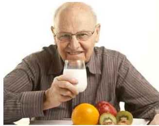
استئوپروز (بوکی استخوان)